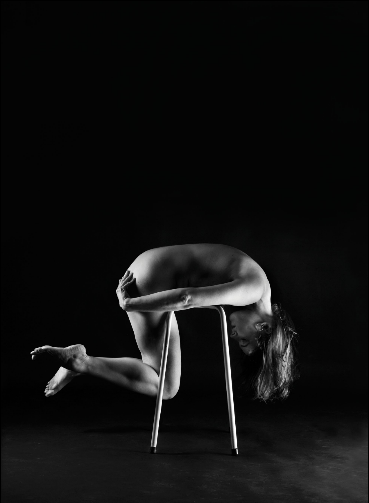
Series: I can take it Spank 2008