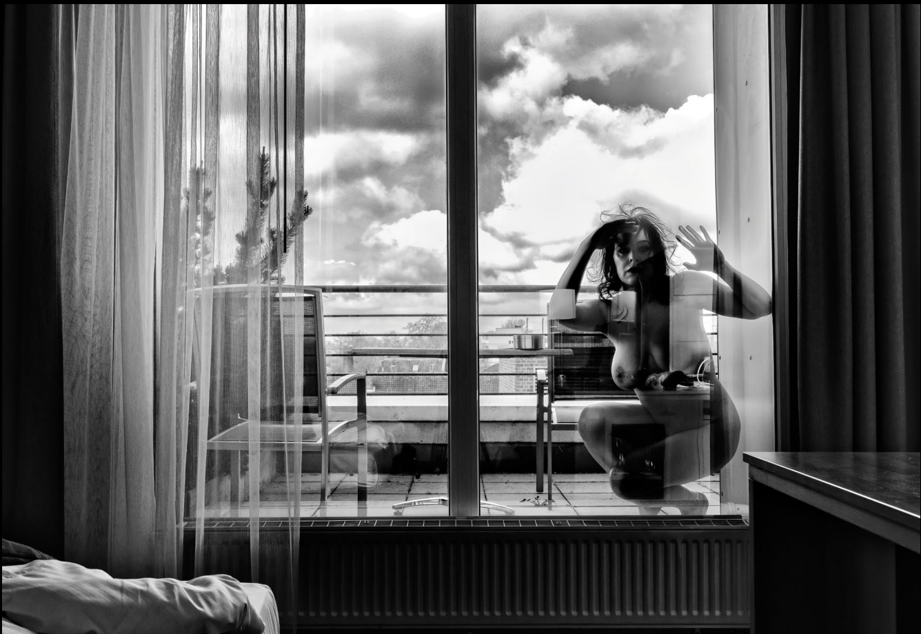
Series: honesome hotel , untitled 2019