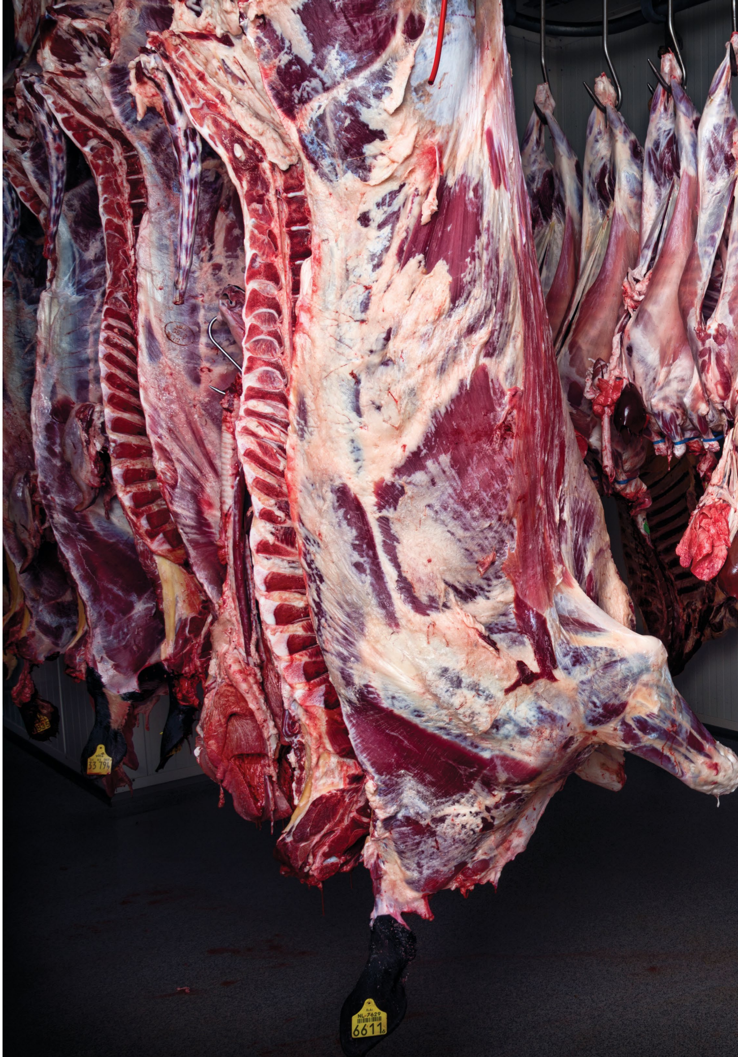
Series: Bit player Butcher 2013